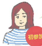
荏原在住 男の子 3ヵ月

品川区の子育てアプリで知りました。今日は赤ちゃんの足型カード作りで、息子のあんよもきれいに取ってもらい、良い記念になりました。そして何より、他のママさんたちとおしゃべりしたり、笑ったり…久々にリラックスできたなって…。コロナ禍で孤独な産後を過ごしてきて、一人で色々考えちゃって。少し疲れ気味だったかも。区の前輩ママが運営しているとのこと、同じ気持ちで話を聞いてもらえて安心しました。やっぱり人と話すのって大切ですね。